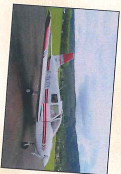
F-GKOY Piper PA-28 160 Ch 4 places