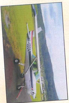
F-GDOA* Cessna 152 110 Ch 2 places