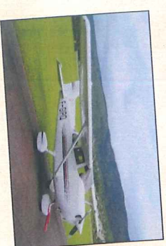
F-GIRO Cessna 172 160 Ch 4 places