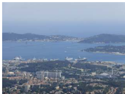
La rade de Toulon