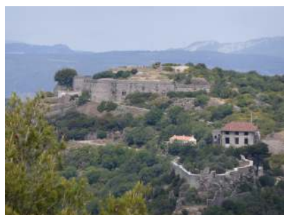
Les ruines du château