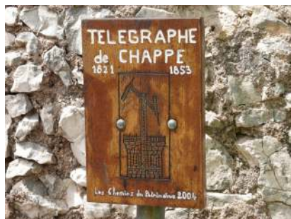
Panneau d'information tour de Chappe