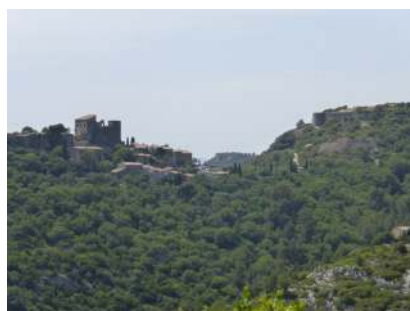
Le vieux village