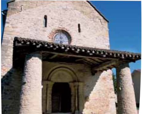
L'église de Saint-Jean-sur-Reyssouze possède un auvent (porche à galonnière) remarquable datant du XIe. Celui-ci est soutenu par des piliers dits "pattes d'éléphant". A l'intérieur de l'église dans la chapelle nord, on peut noter deux curieuses têtes humaines sculptées.