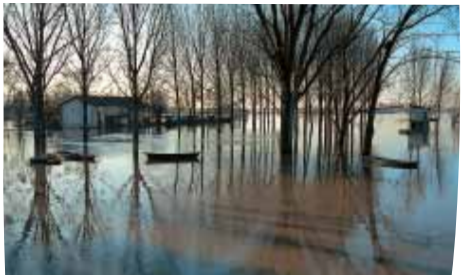
La Saône en crue à Pont-de-Vaux transfigure, aux saisons de pluie, le paysage de la vaste plaine.