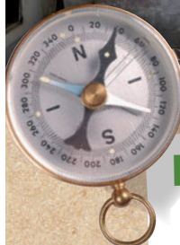
Eglise de Larroque