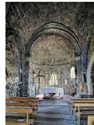
L'église de Lachapelle Graillouse

L'église Notre-Dame de l'Assomption existait déjà en 938. Assez rapidement, elle devient, suite à un héritage, un prieuré de l'abbaye de Cluny (Bourgogne), puis ce même prieuré est géré à partir du XIème siècle par l'abbaye St-Chaffre du Monastier. Une vraie merveille... Maria Victorina Celina...c'est le très joli nom de la cloche la plus récente fondue à Toulouse en 1920 ; la plus ancienne datant de 1705