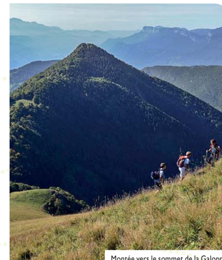
Montée vers le sommet de la Galoppaz