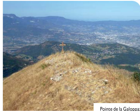
Pointe de la Galoppaz