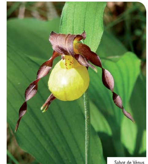
Sabot de Vénus