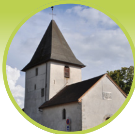
Église de Droisy