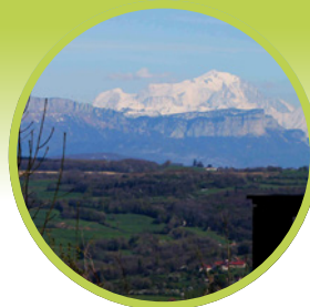
Vue côté Mont-Blanc