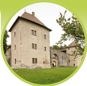
Château de Clermont